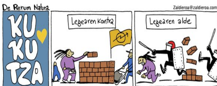
Zaldireroa, Berria egunkaria, 2011-09-24